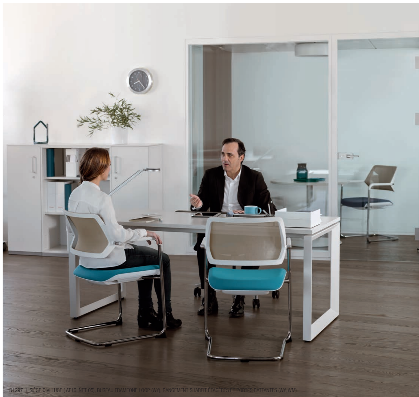
D1297 | SIÈGE QIVI LUGE (AT16, NET 05), BUREAU FRAMEONE LOOP (WY), RANGEMENT SHAREIT ÉTAGÈRES ET PORTES BATTANTES (WY, WM)