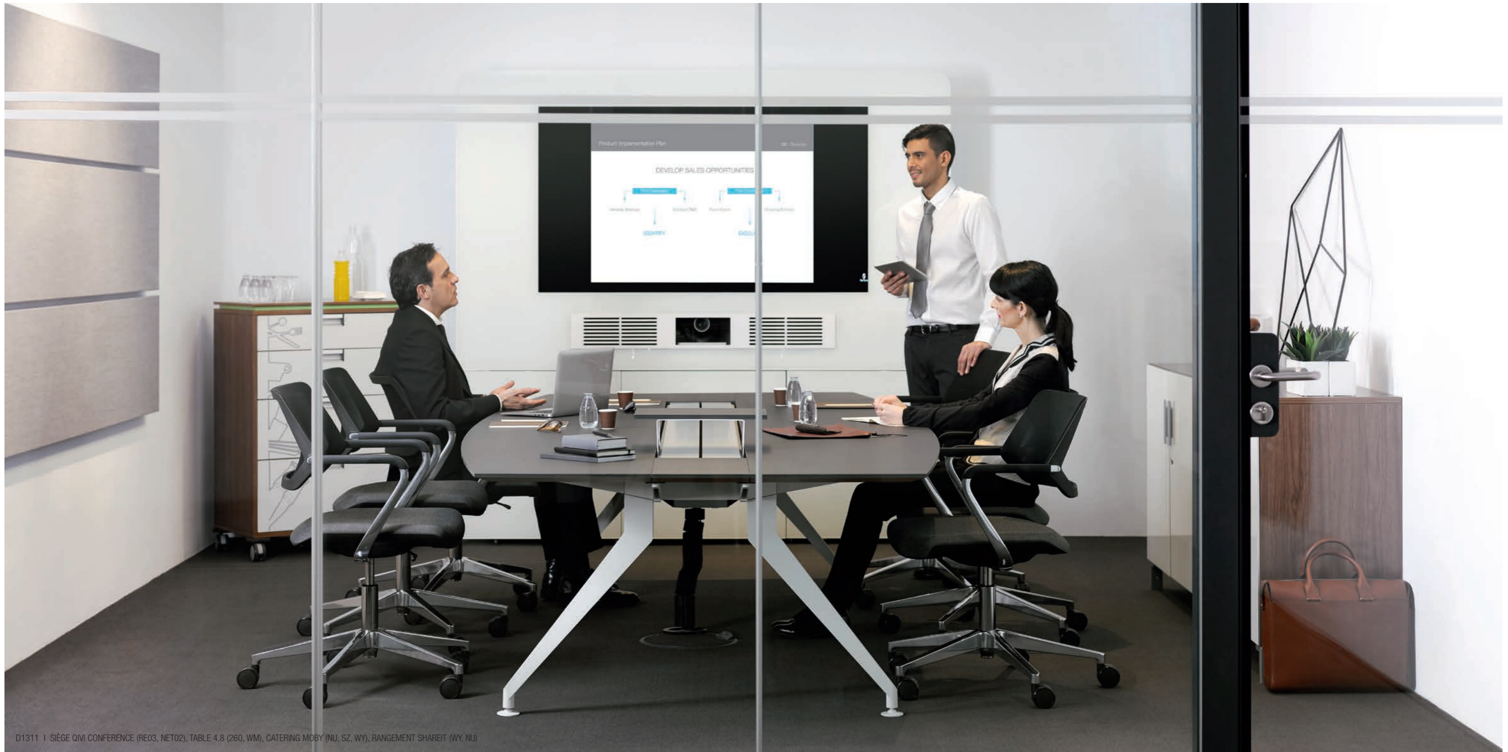
D1311 | SIÈGE QIVi CONFERENCE (RE03, NET02), TABLE 4.8 (260, WM), CATERING MOBY (NU, SZ, WY), RANGEMENT SHAREIT (WY, NU)