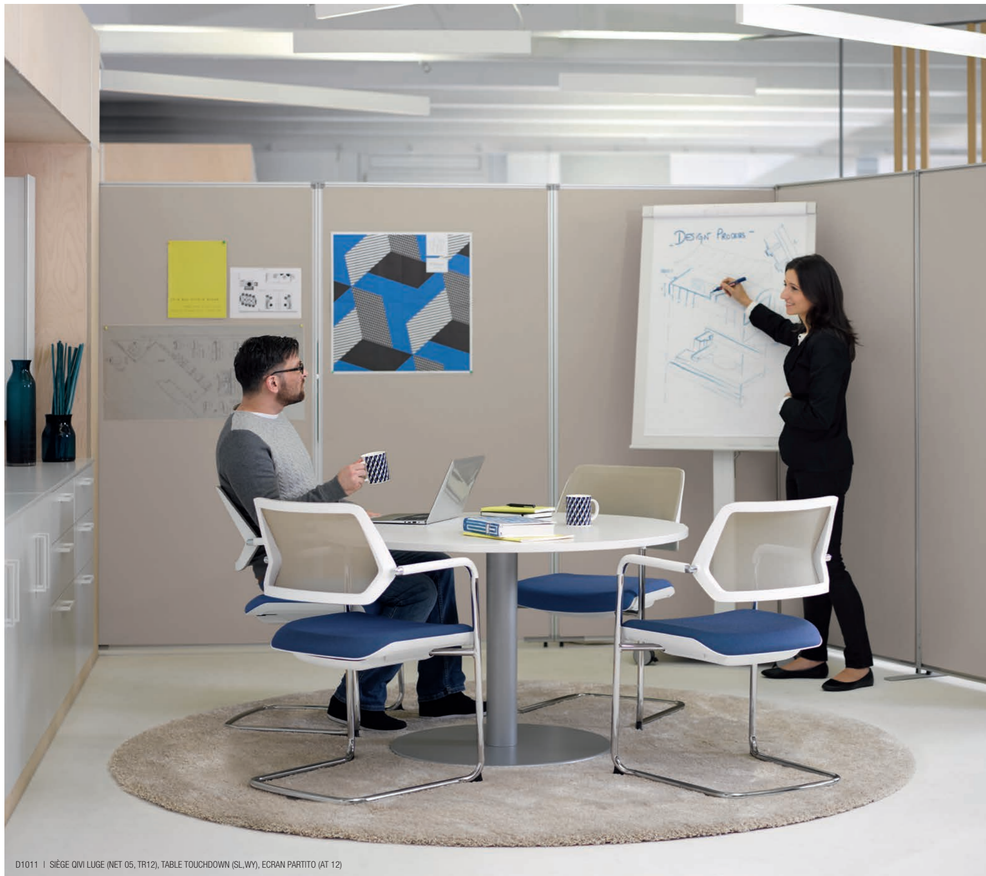
D1011 | SIÈGE QIVI LUGE (NET 05, TR12), TABLE TOUCHDOWN (SL,WY), ECRAN PARTITO (AT 12)