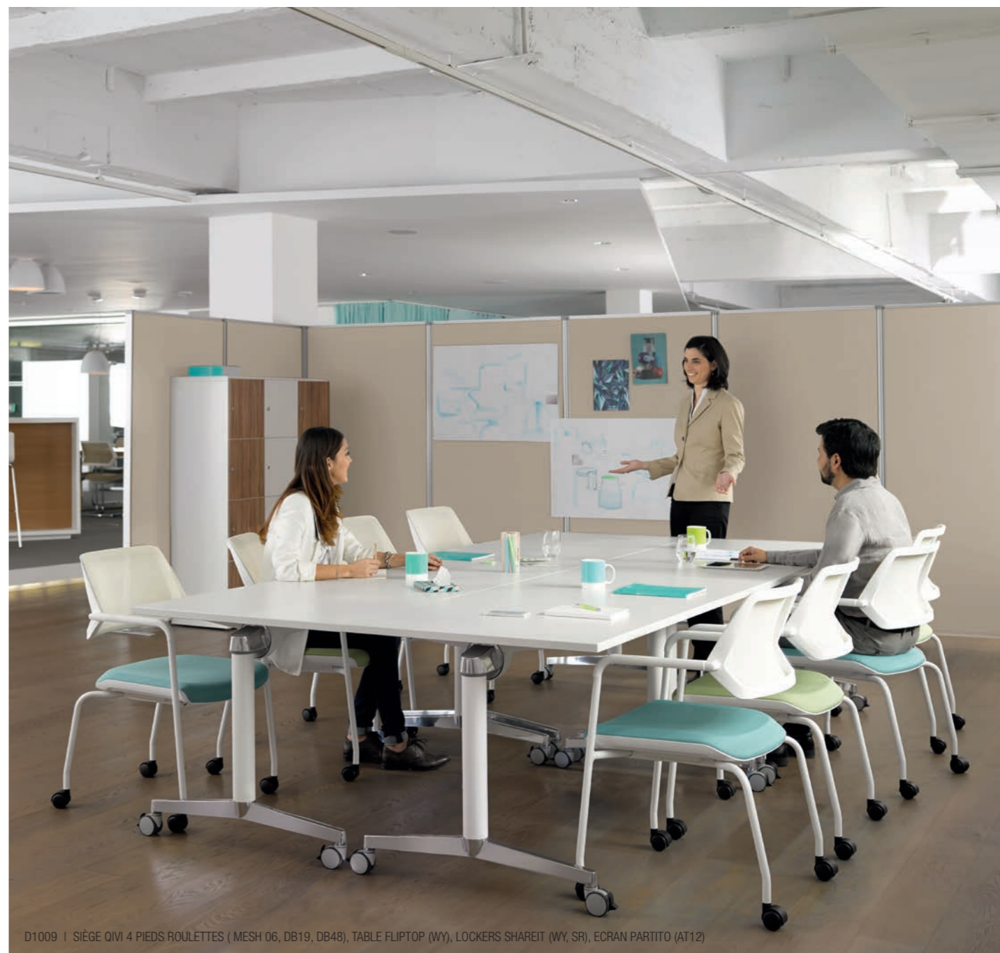
D1009 | SIÈGE QIVI 4 PIEDS ROULETTES ( MESH 06, DB19, DB48), TABLE FLIPTOP (WY), LOCKERS SHAREIT (WY, SR), ECRAN PARTITO (AT12)

Qivi est le siège de collaboration idéal pour travailler en binômes, en petits groupes ou en grands groupes. Il contribue à la productivité des réunions, qu'elles se tiennent dans des espaces informels, dans des salles classiques ou dans des salles très formelles.