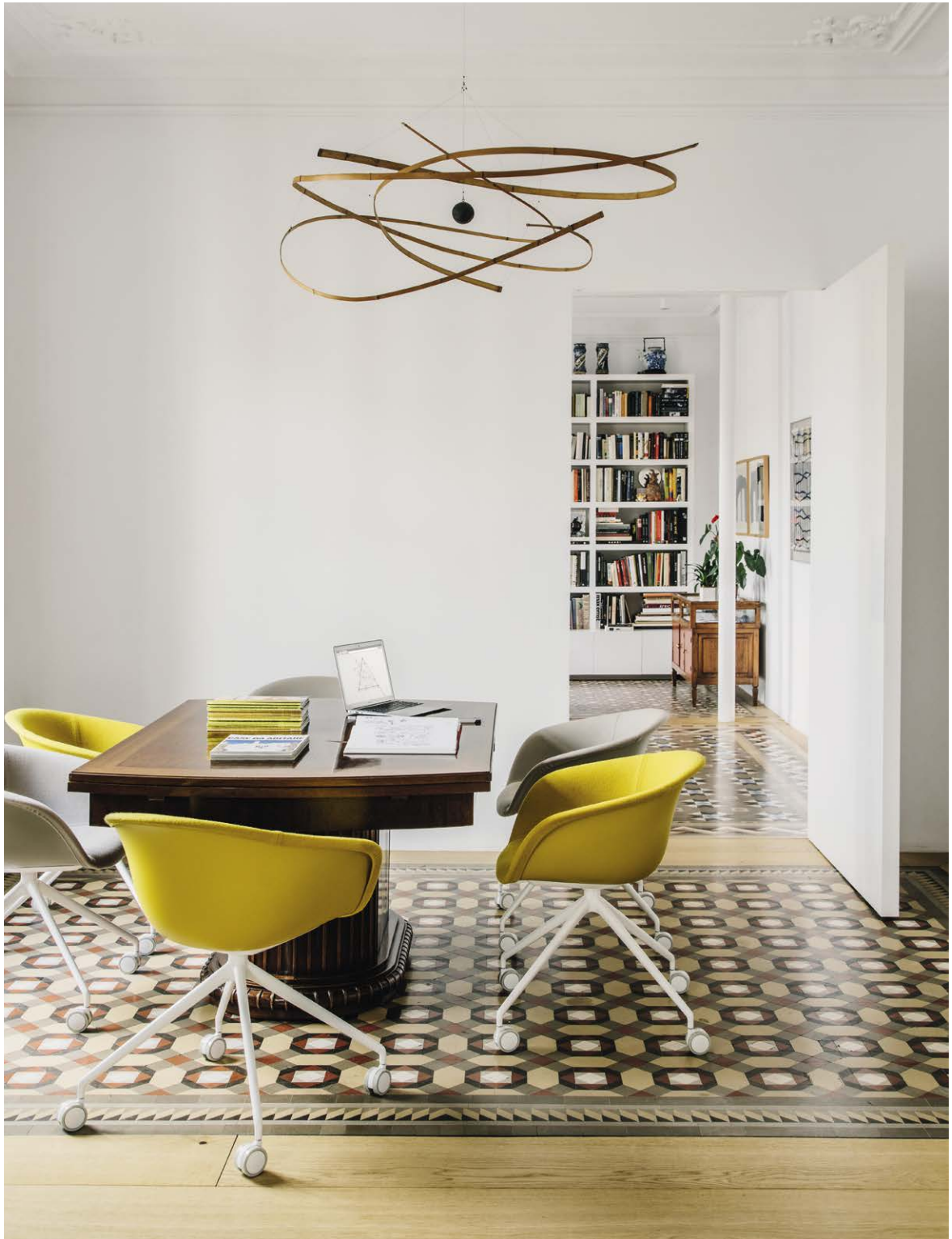
Home office Barcelona, Spain Art. 4217